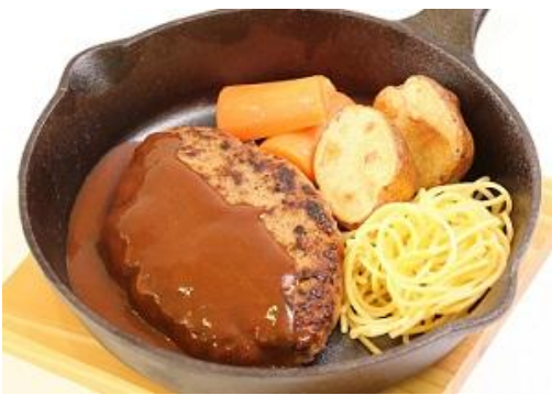
※ハンバーグデミソース